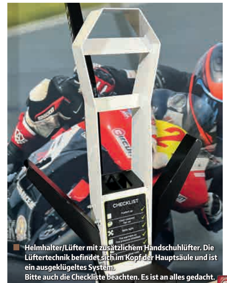
■ Helmhalter/Lüfter mit zusätzlichem Handschuhlüfter. Die Lüftertechnik befindet sich im Kopf der Hauptsäule und ist ein ausgeklügeltes System. Bitte auch die Checkliste beachten. Es ist an alles gedacht.