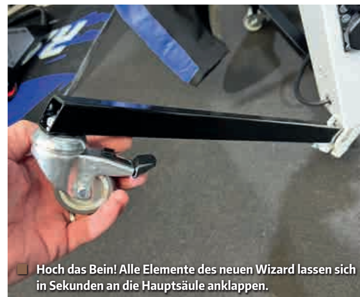
■ Hoch das Bein! Alle Elemente des neuen Wizard lassen sich in Sekunden an die Hauptsäule anklappen.