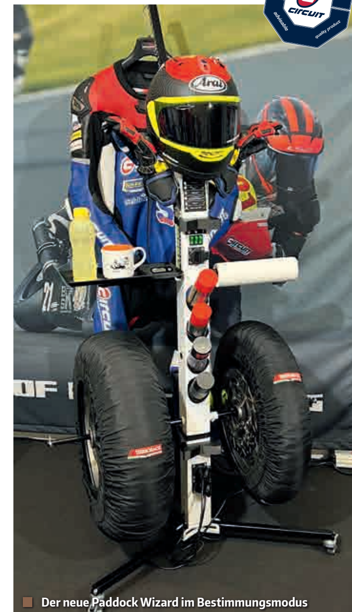
■ Der neue Paddock Wizard im Bestimmungsmodus