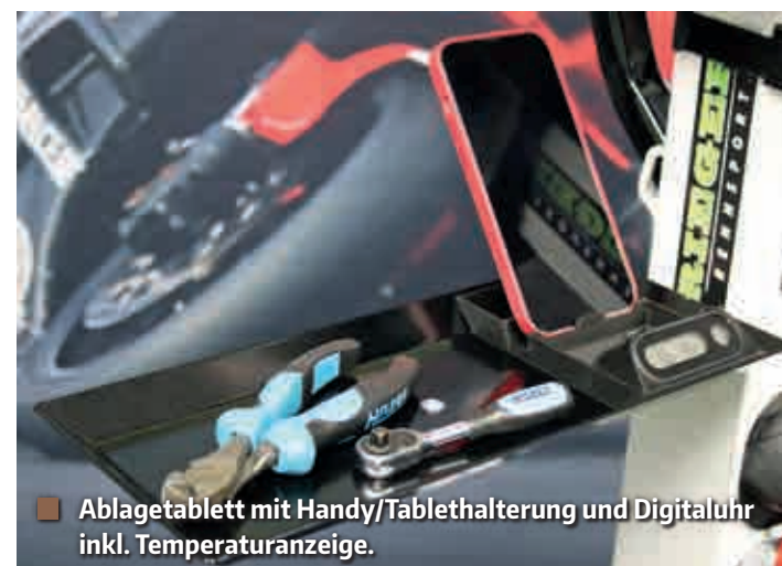
■ Ablageblett mit Handy/Tablehalterung und Digitaluhr inkl. Temperaturanzeige.